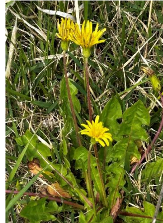
カンサイタンポポ