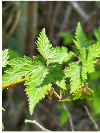
ナガバモミジイチゴ