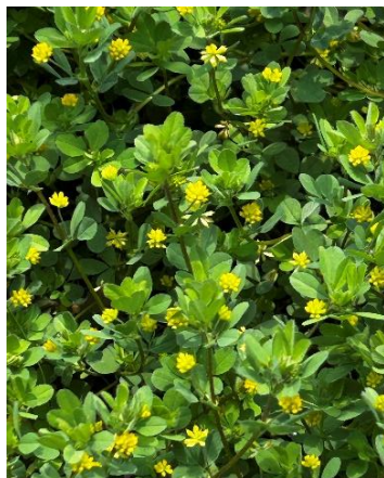
コメツブツメクサ