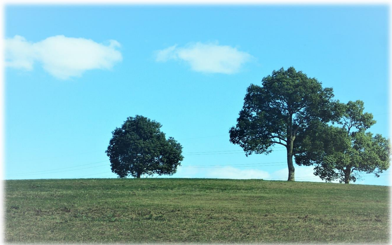
山田池公園芝生の丘周辺の色々な樹木を観察しました