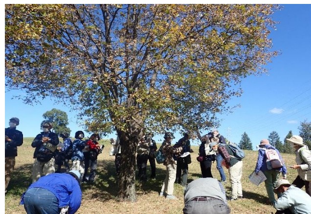
「イタヤカエデ」の種集め