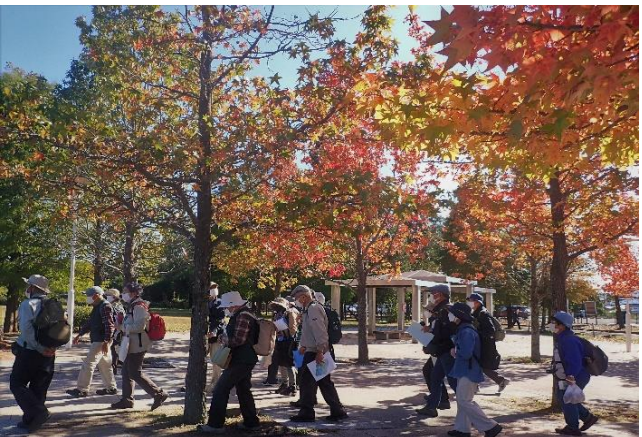
色づく「アメリカフウ」