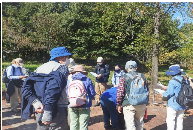
お天気最高!! 熱くないそう!!