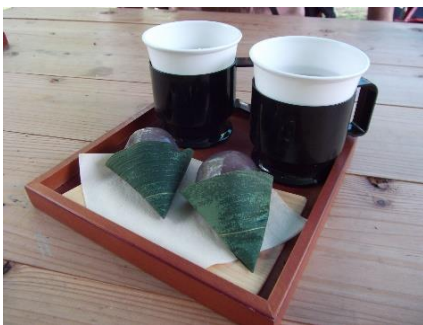
クロモジ番茶と葛餅