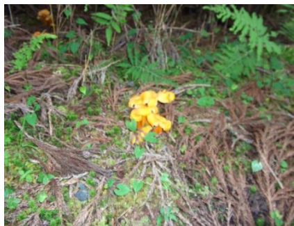
鮮やかな色のキノコ