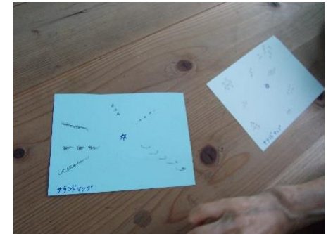
サウンドマップ（ネイチャーゲーム）