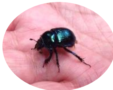
ルリセンチコガネ