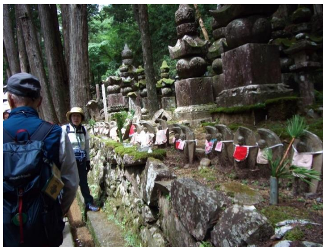
お地藏さん 地藏菩薩クシティ(大地)・ガルバ(胎内・子宮)