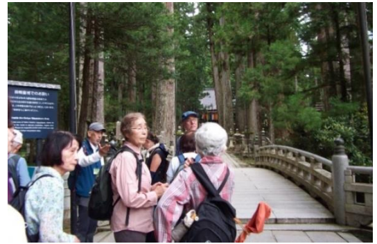
御廟橋 これより先は聖域