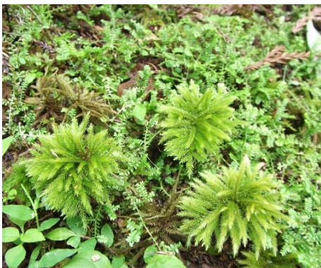
コウヤノマンネングサ (コケ植物)