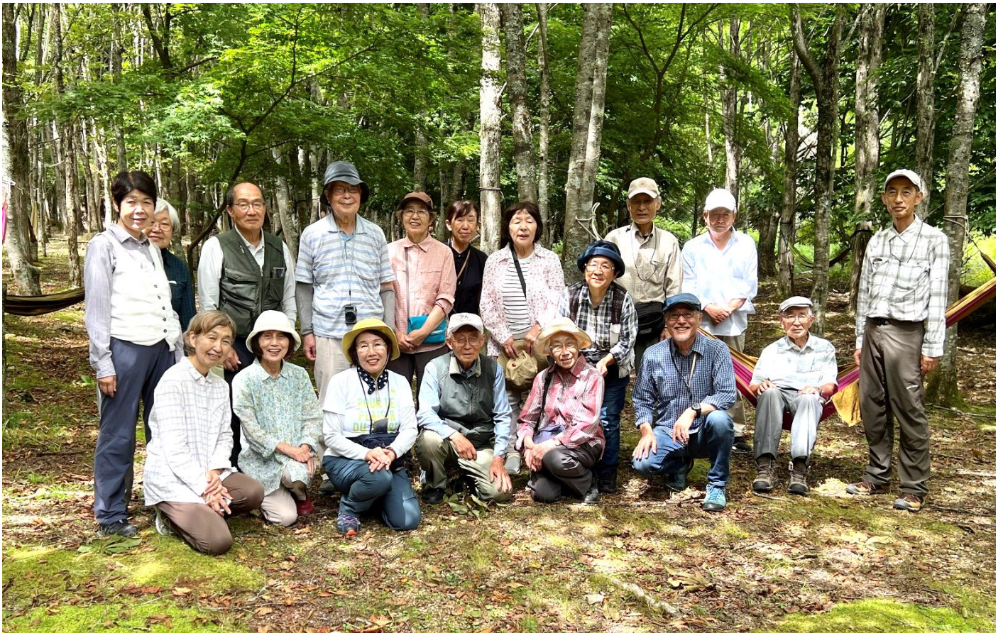
ハンモックの森で集合写真