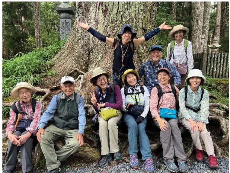
川北班 スギの大木の前で記念写真