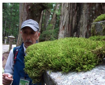
苔は根がない（ヒジキゴケ）