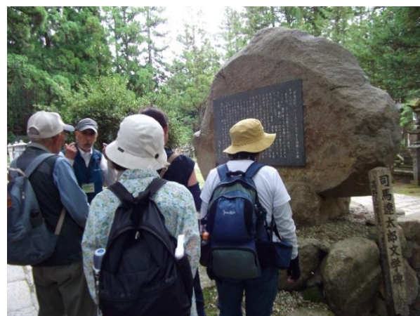
司馬遼太郎 文学碑