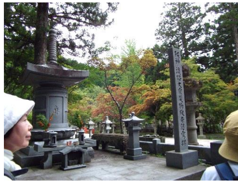
阪神大震災慰霊碑