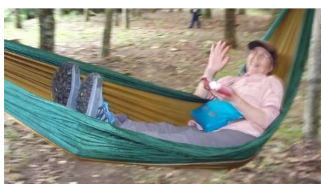
昼食後はハンモックでリラックス