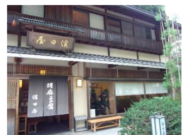
おまけ 胡麻豆腐の濱田屋