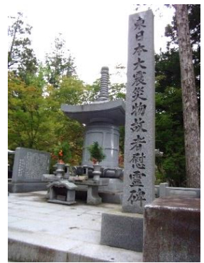
東日本大震災慰霊碑