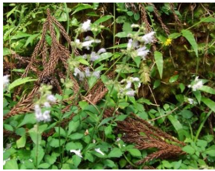
アキノタムラソウ