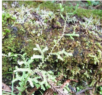
クラマゴケ (シダ植物)