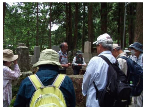
木の中が空洞になったスギ、外側の形成層は生きている！