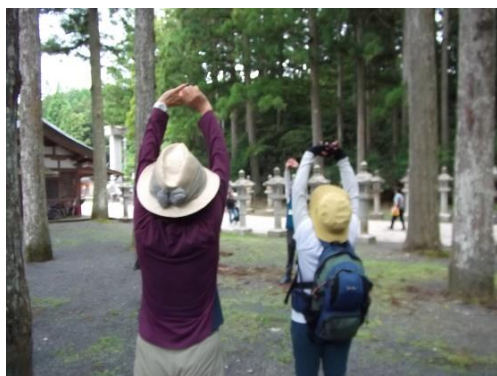
中の橋参道入口で整理体操