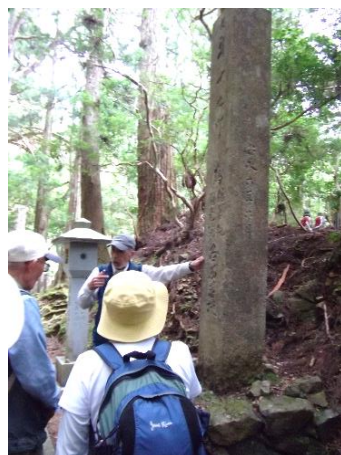
町石 十九町 大正時代に再建、彫りが浅い。 二十町 彫りが深い。