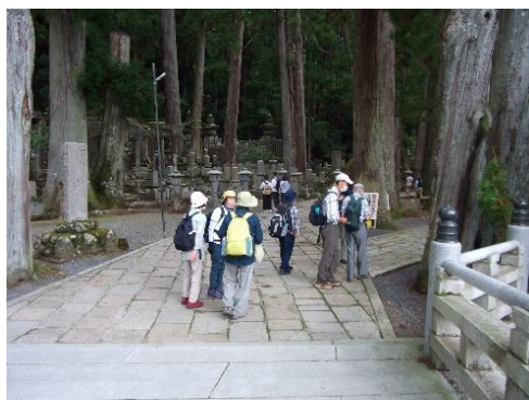
奥の院入り口 一の橋