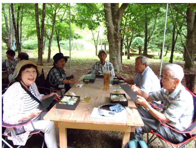
精進料理のお弁当をいただきます。