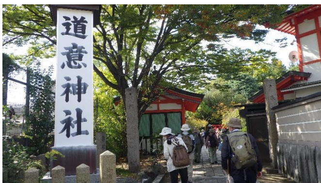
どい神社から祇園橋緑地へ 細長い緑道が続く