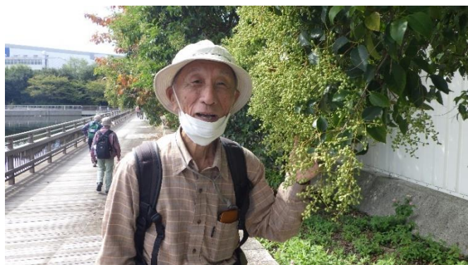
いつも笑顔が最高！