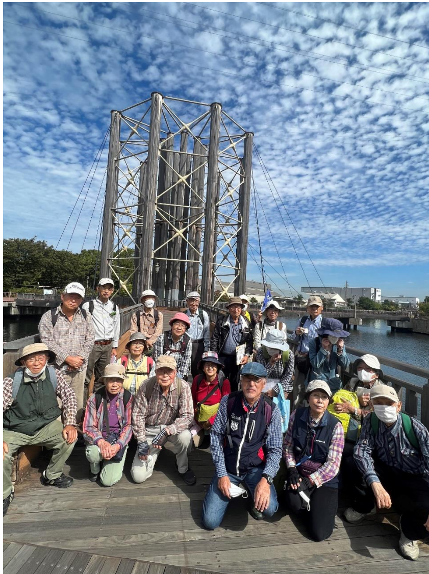
であい橋で記念撮影 空もきれい！ 真っ青な空にいわし雲？・・・