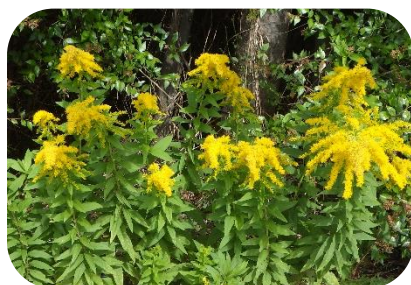
セイタカアワダチソウ