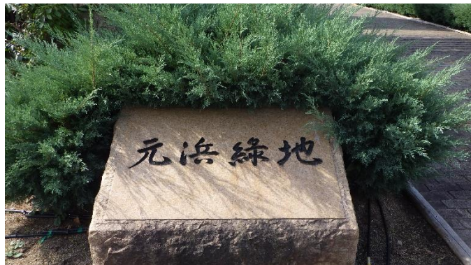
大気汚染対策として整備された緑地第一号（全国で）