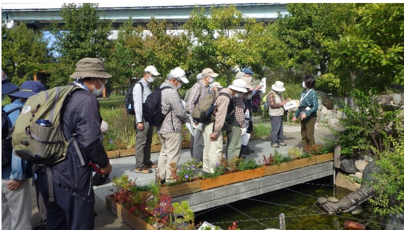
生物多様性あまもり戦略

地域の生物多様性保全を目的に、人の手によって生き物いっぱいの森を 100 年かけて作ろうという計画