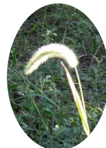
アキノエノコログサ