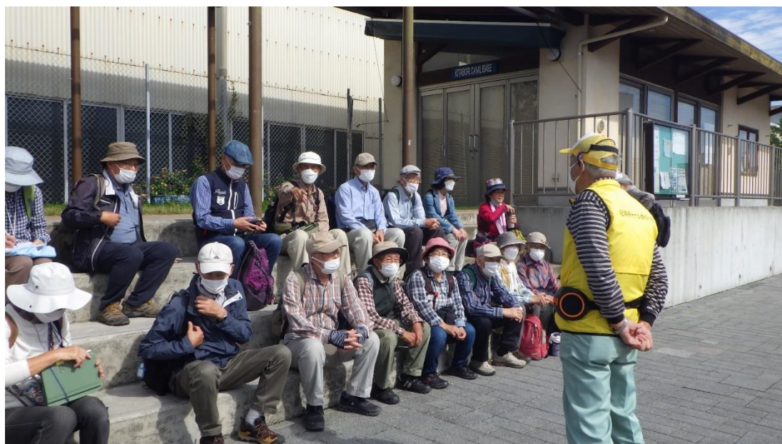
ガイドさんは対話形式、次々質問攻め、間合いもよく、飽きさせない！ウーン！インプリの勉強になるう！