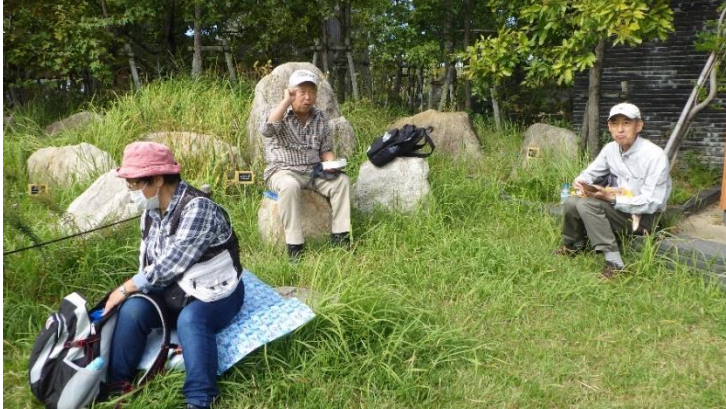
たのしい ランチタイム♪♪