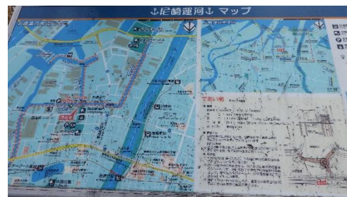
尼崎の町の3分の1が海拔ゼロメートル地帯、高潮や洪水から街を守るため閘門式防潮堤ができた。