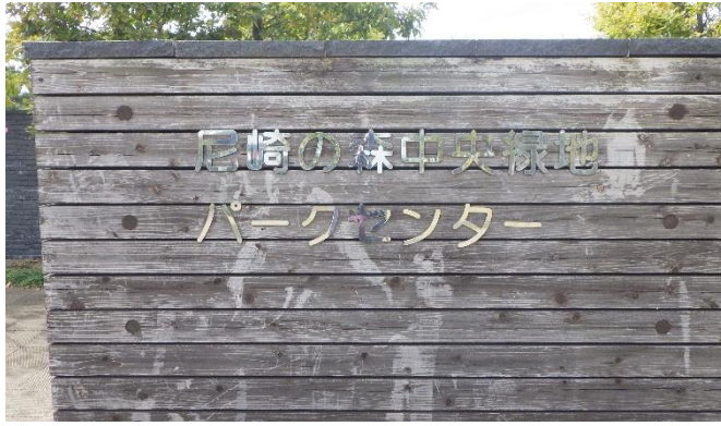
尼崎の森中央緑地