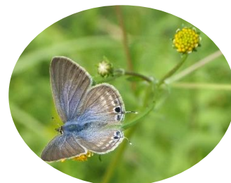
コセンダングサと蝶