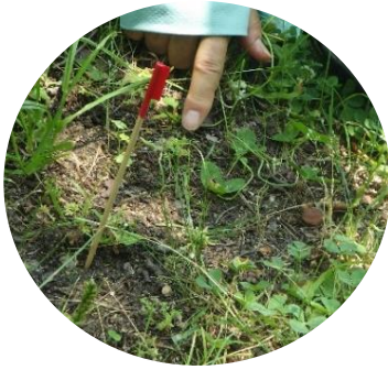
インプリ (メリケントキンソウ) トゲに注意！危険な外来植物