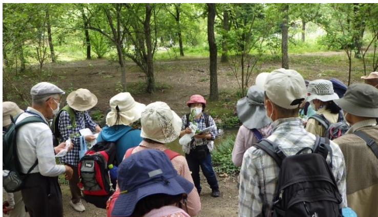
ネイチャーゲーム (宝さがし)