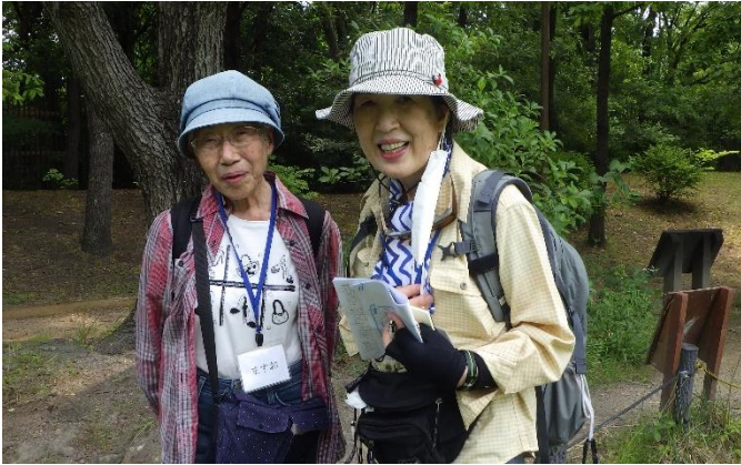
みんなの笑顔が素敵！！