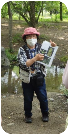
インプリ (ドクダミの不思議)