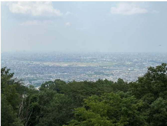
日の丸展望台から大阪市内を望む（ハルカス？）