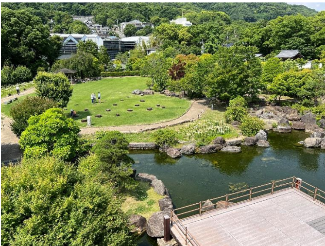
展望棟から園内を望む