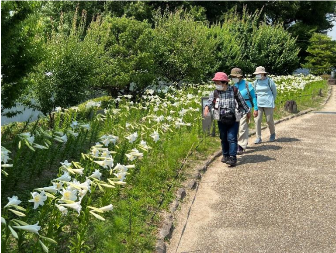
テッポウユリ（池田城跡公園）