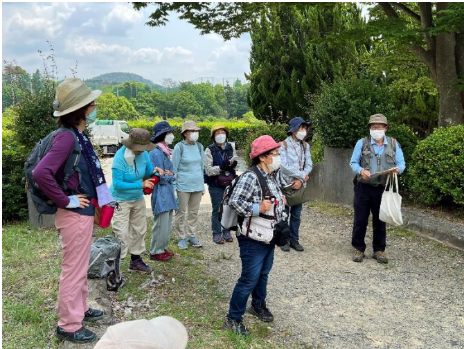
出発前担当者からのお知らせ