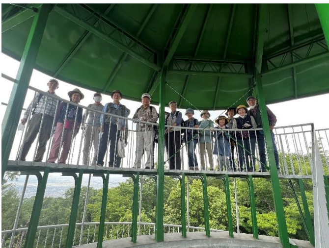
日の丸展望台内部