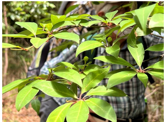
クロモジ 枝に芳香があり爪楊枝に利用