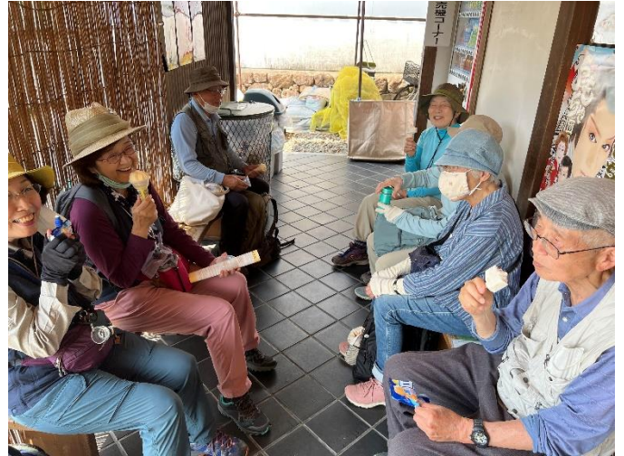
アイスが美味しい