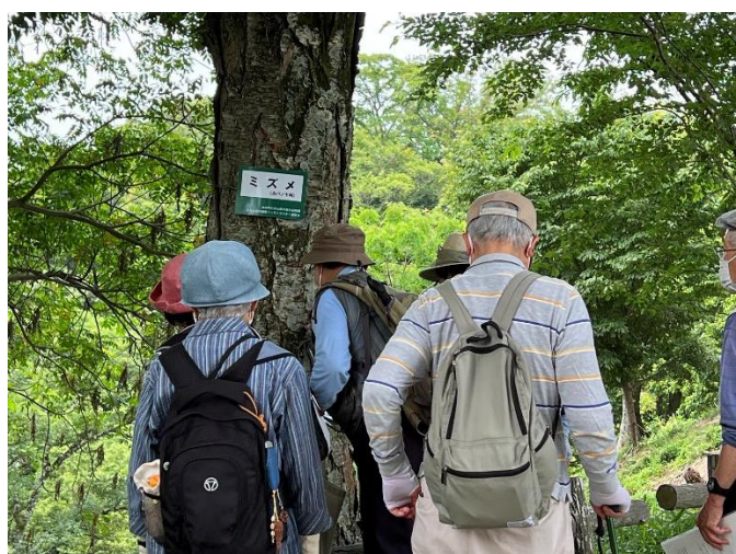
ミズメ 樹皮からサロメチールの香りが・・・