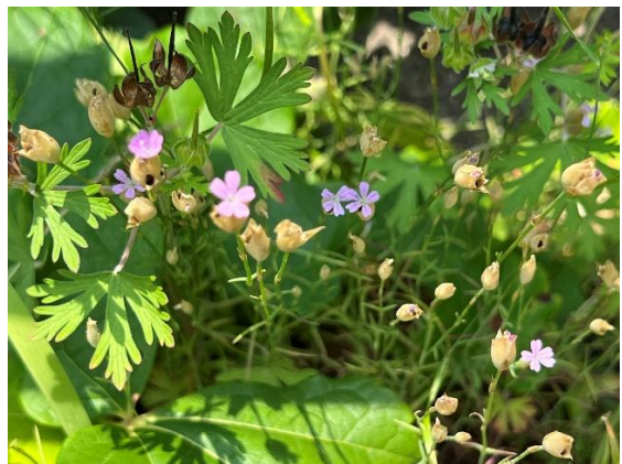
イヌコモチナデシコ