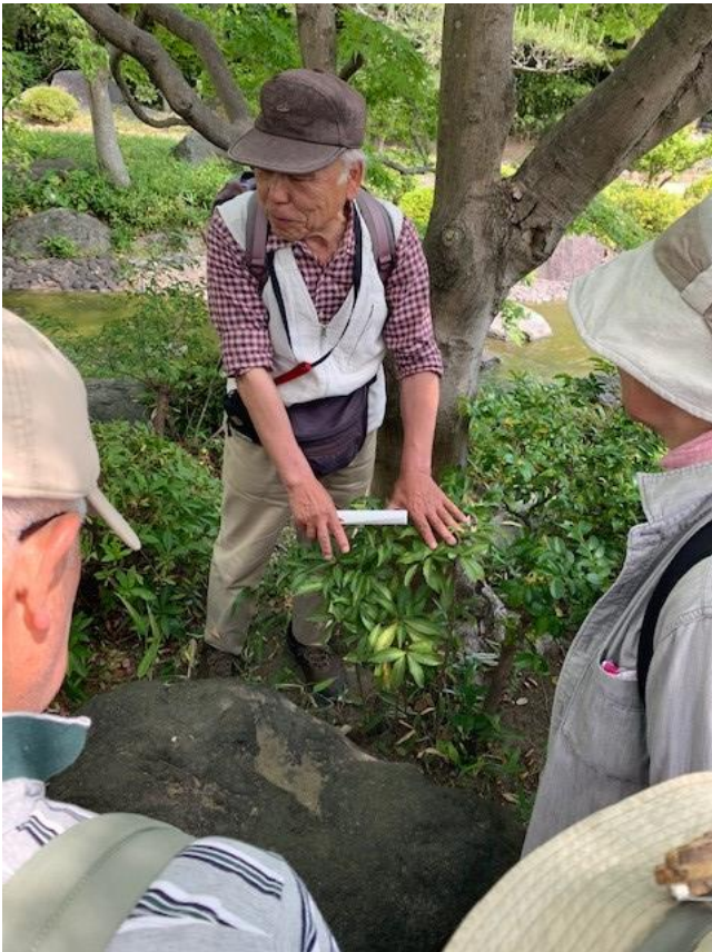
「センリョウ」? 「マンリョウ」?