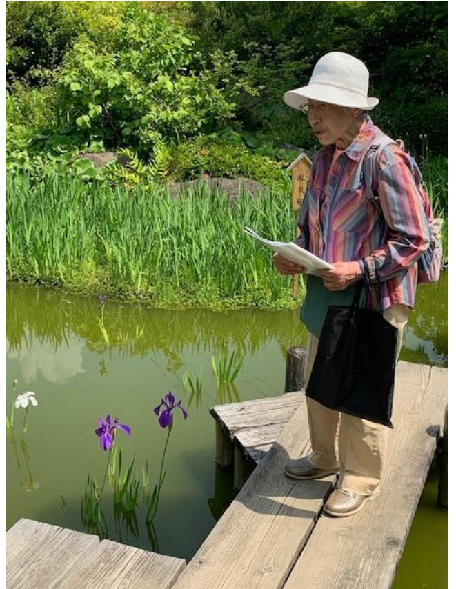
「ハナショウブ」? 「アヤメ」? 「カキツバタ」? インプリプレイ