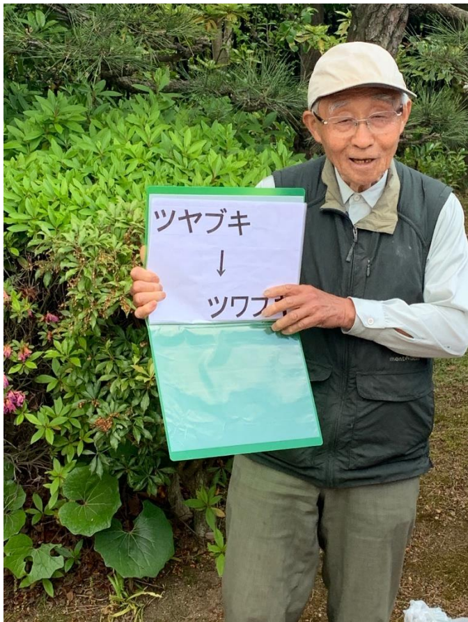
「ツワブキ」のインプリプレイ