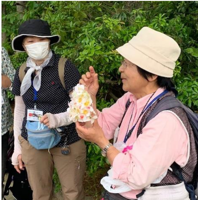
「トチノキ」のインプリプレイ