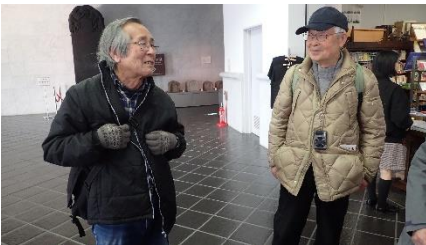
木製蒸気機関車模型

1890 年代に作られた木製の教育用蒸気機関車模型 (2.2 × 0.6 × 1.0m、縮尺は 1/4)