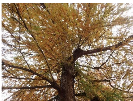
ヨーロッパイチイ 毒殺事件に登場 種が毒