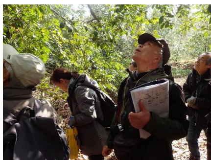
インプリプレイ：ムクロジ

●虫糞茶（ちゅうふんちゃ）は、コナシ、茶、ノグルミなどの葉などを食べる蛾の幼虫の糞を乾燥させた、中国茶の一種。使用する植物と蛾の種類によって異なるタイプがある。