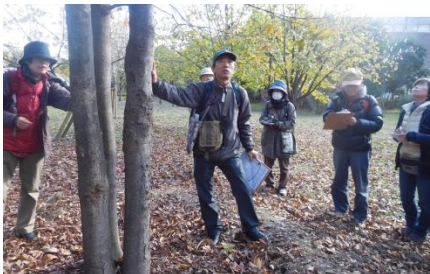
ケヤキの種子散布