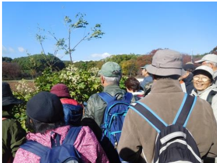
ヤツデ 雄性期と雌性期