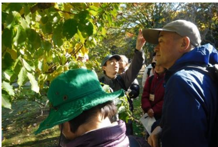
コバノシナノキ 種子散布