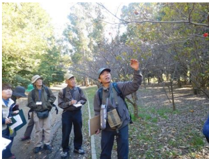
ヤマボウシ 仮軸分枝、湾曲の特徴ある枝振り