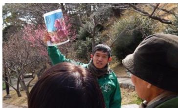
インプリ: シナマンサク