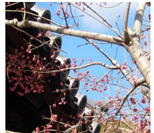
インプリ: 源平の庭