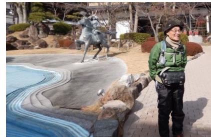
左: 平敦盛、笛の名手 右: 熊谷直実