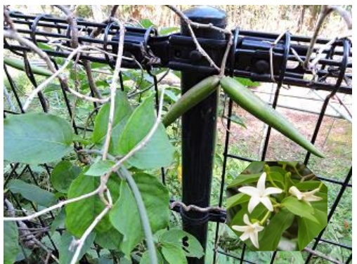
シタキソウ (ガガイモ科) 花6月