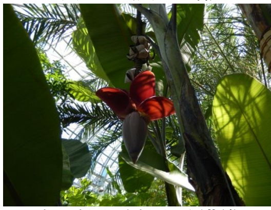
クロバナナ（バナナの園芸種）