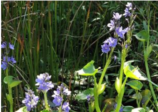
ミズアオイ（ミズアオイ科）