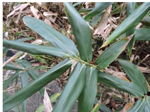
「家守りし妻の恵みやわが学び世の中のあらん限りやスエコザサ」(イネ科)