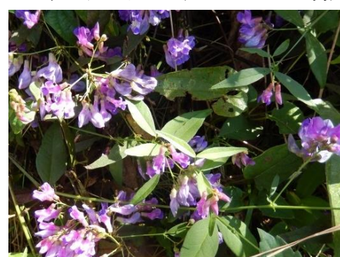
ナンテンハギ（マメ科）