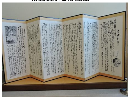
司馬遼太郎からのメッセージ 寺田屋で襲われた龍馬は高杉晋作から譲り受けたピストルで危機を脱した。