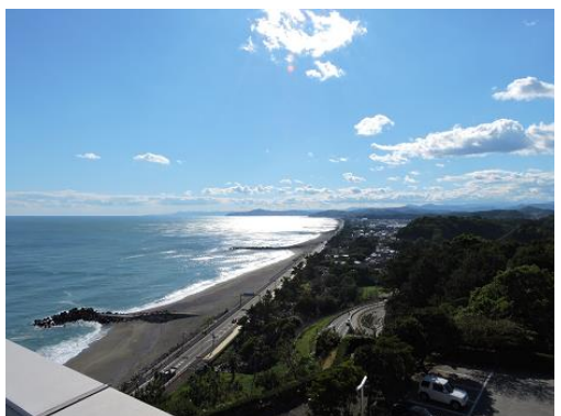
“龍馬の見た海” は果てしない