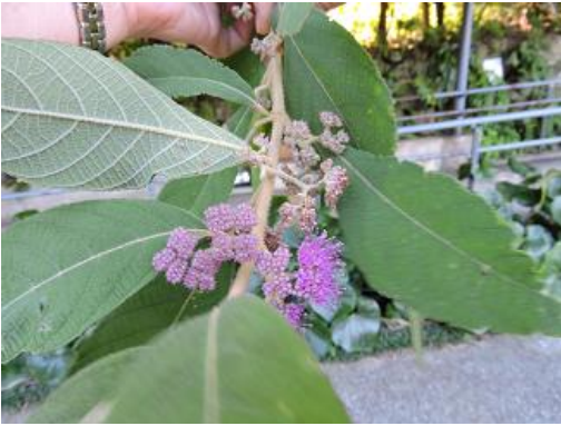
ビロードムラサキ (クマツヅラ科)