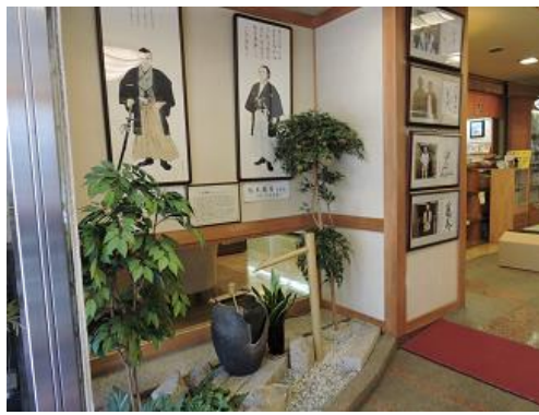
館内は龍馬の展示がいっぱい