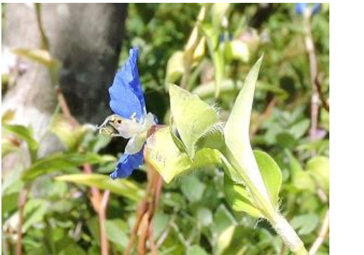
オオボウシバナ (ツユクサ科)