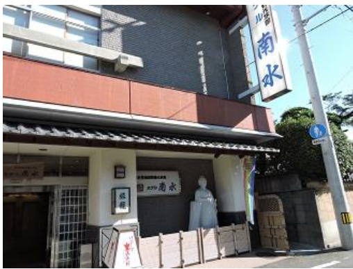
龍馬の屋敷跡に建つ ホテル南水