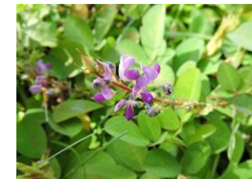
シバハギ (ヌスビトハギの仲間)