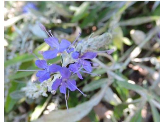
トウテイラン（ゴマノハグサ科）