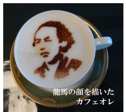
龍馬の顔を描いた カフェオレ