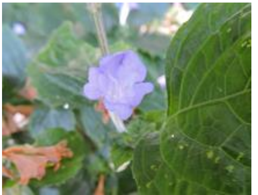
スズムシバナ (キツネノマゴ科)