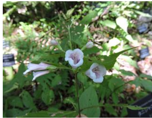
タニジャコウソウ (シソ科)