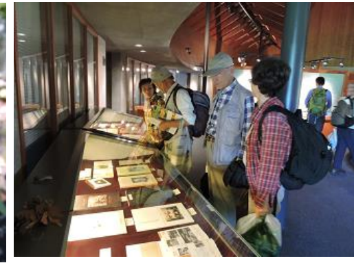
牧野富太郎記念館 本館