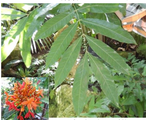
ムユウジュ(マメ科)