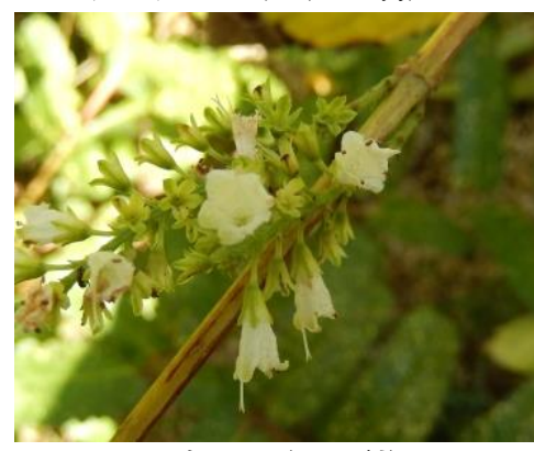
シモバシラ（シソ科）