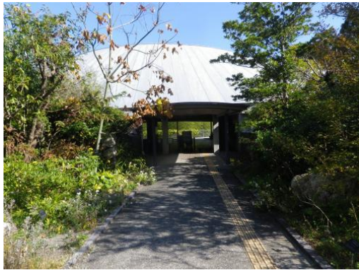
高知県立牧野植物園 正面