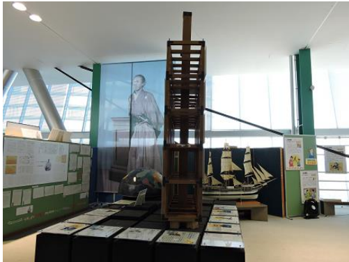
常設展示と貯蔵品