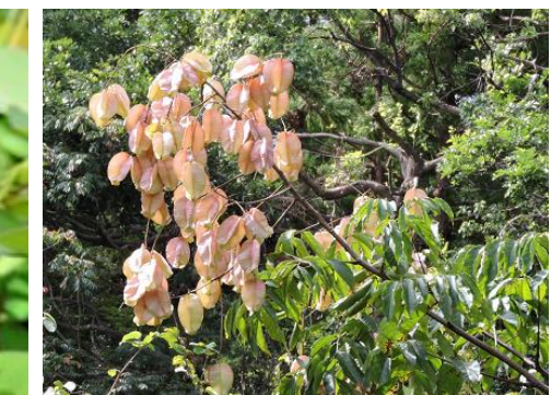
モクゲンジ(センダンバノモクゲンジ)