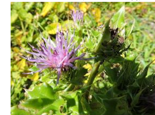
ハマアザミ（別名 ハマゴボウ）