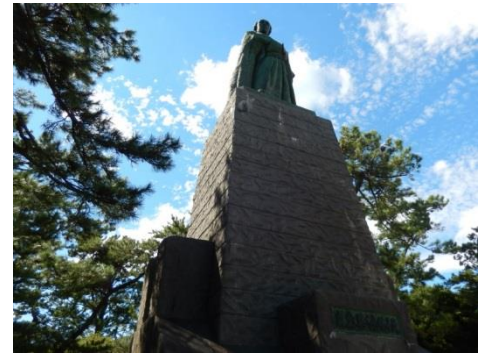
龍馬像 総高13.5m 龍馬5.3m