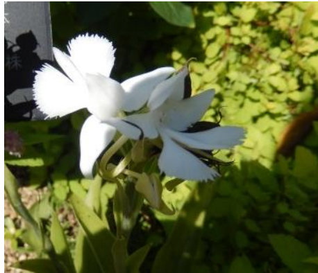
ダイサギソウ（ラン科）