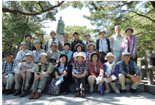
坂本龍馬像の前にて