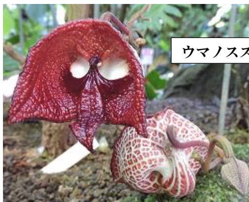
ウマノスズクサ科