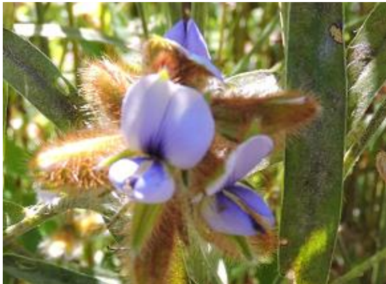
タヌキマメ(単葉・細長い葉) 午後に開花