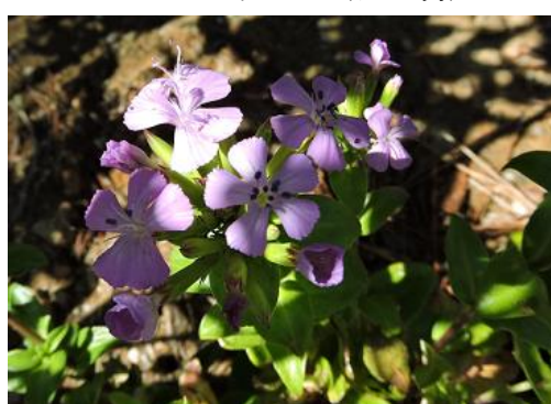
ハマナデシコ（ナデシコ科）