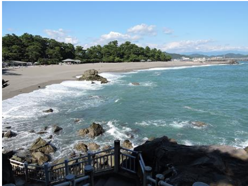
竜王岬から桂浜を望む