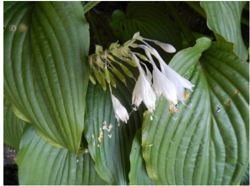
スダレギボウシ (ユリ科)