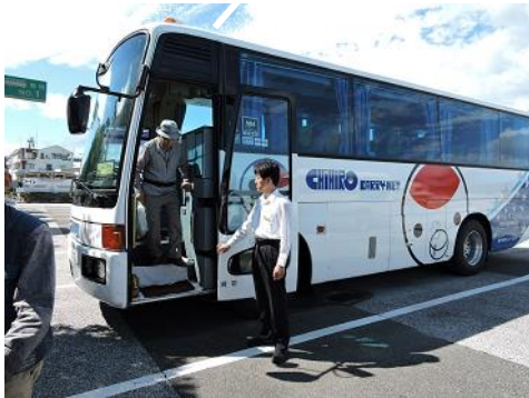
二日間お世話になります