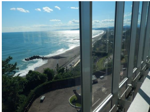
龍馬の声が聞こえてくる