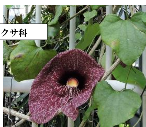
アリストロキア・ギガンテア