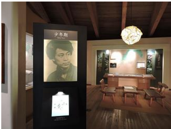
牧野富太郎の生涯（少年期）