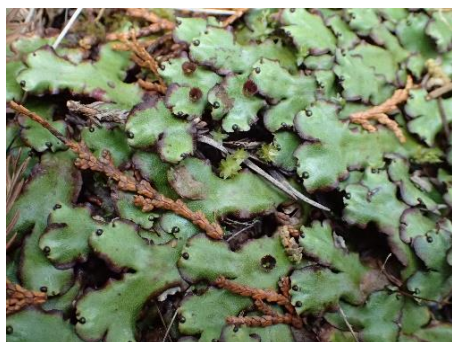
苔類 (ジンガサゴケ?)