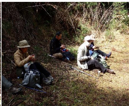
ミツマタの下でお弁当タイム