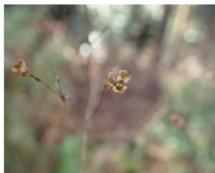
マツカゼソウの果実