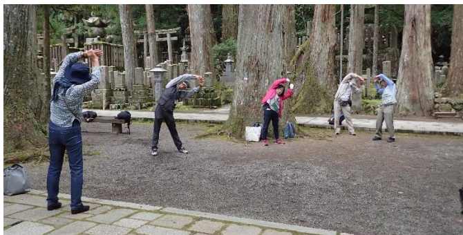
ネイチャーガイドの皆さん