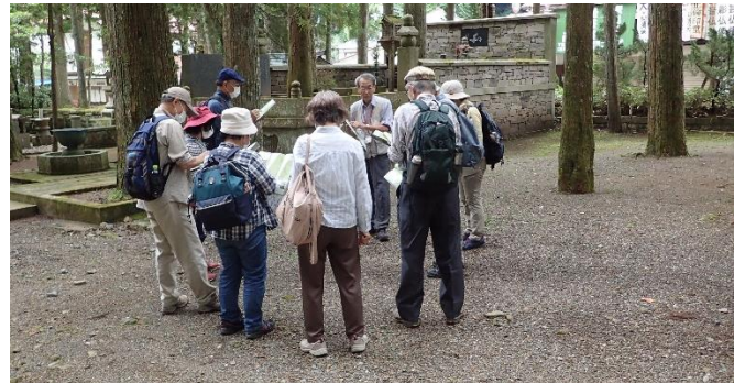
表杉（日光・吉野など太平洋側）と裏杉（積雪の多い日本海側）枝をたれ下げ雪の害を防ぐ が混在