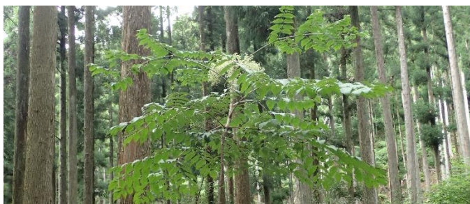
女王様はコシアブラ クリンソウの群生地