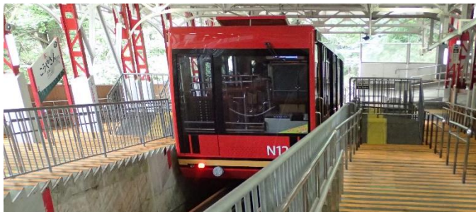
コロナ対策？天井の開いたケーブル