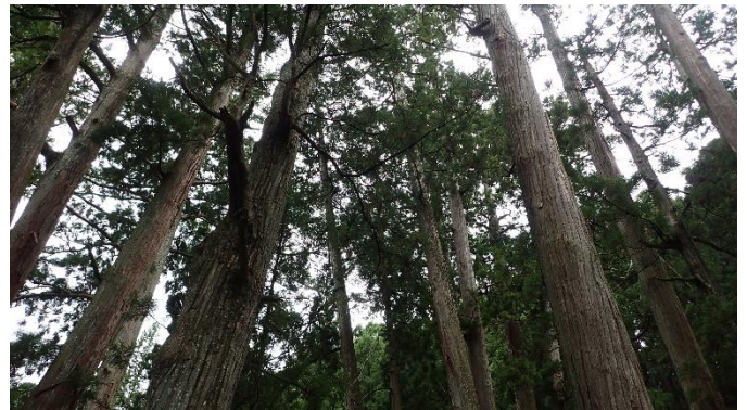
高野槇 高野六木（スギ、ヒノキ、モミ、ツガ、アカマツ、コウヤマキ）の一つ