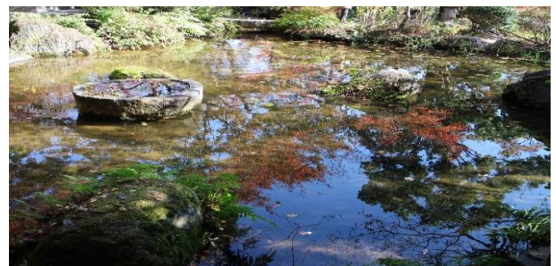
池の水にも紅葉が映える