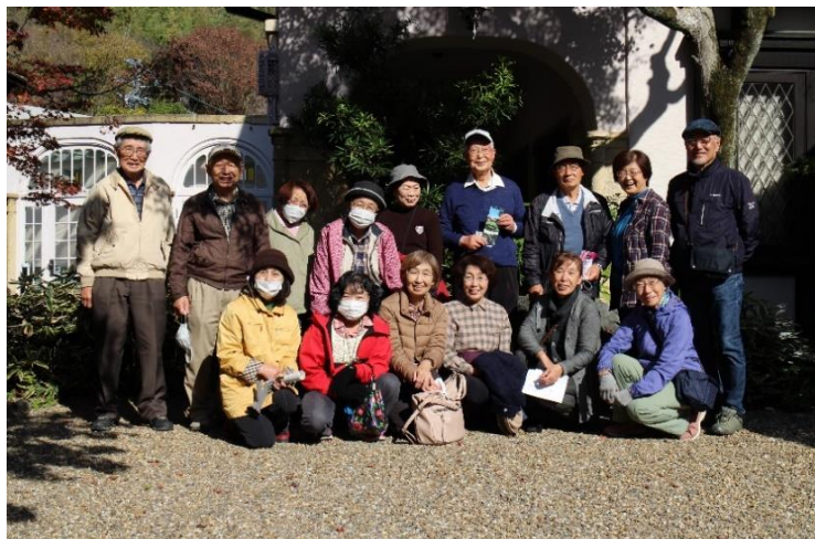
大山崎山荘の前で全員集合