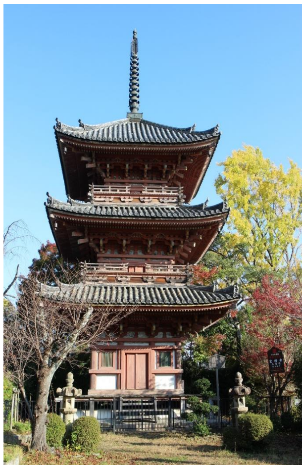
豊臣秀吉一夜之塔