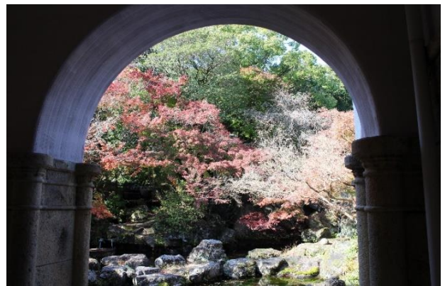
アーチ状の柱の間から見える中庭