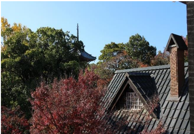
窓から見える宝積寺三重塔