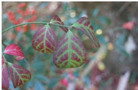
ニシキギのスケルトン