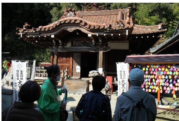
宝積寺大黒天神の説明を受ける