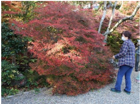
庭には紅葉したドウダンツツジ