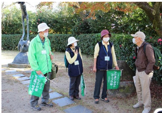
お世話になる三人のガイドさん