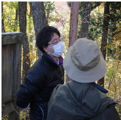
案内して頂いたガイドさん