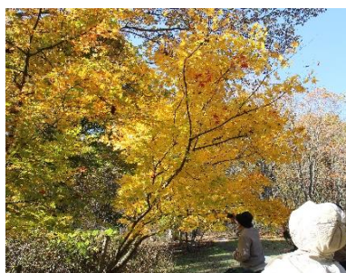
黄葉に魅せられる