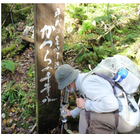
カツラの千年水を汲む